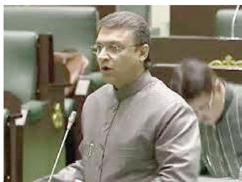
లేదంటే ఆందోళనలు చేస్తాం : ఎమ్మెల్యే లక్ష్మరుద్దీన్ ఓవైసీ